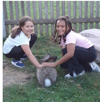
Ferienfreizeit auf dem Koanzhof – Josef Schörghuber-Stiftung für Münchner Kinder