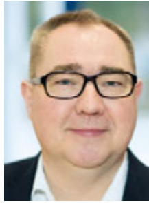
Stadtrat Beppo Brem Grünen