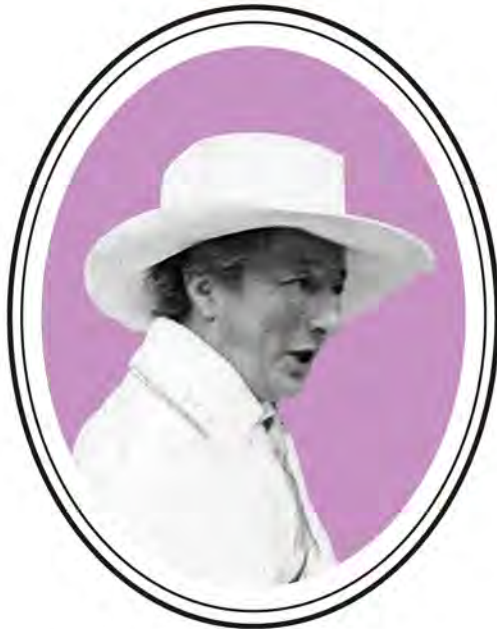
Anita Augspurg Preis München zur Förderung der Gleichberechtigung für Frauen und Mädchen