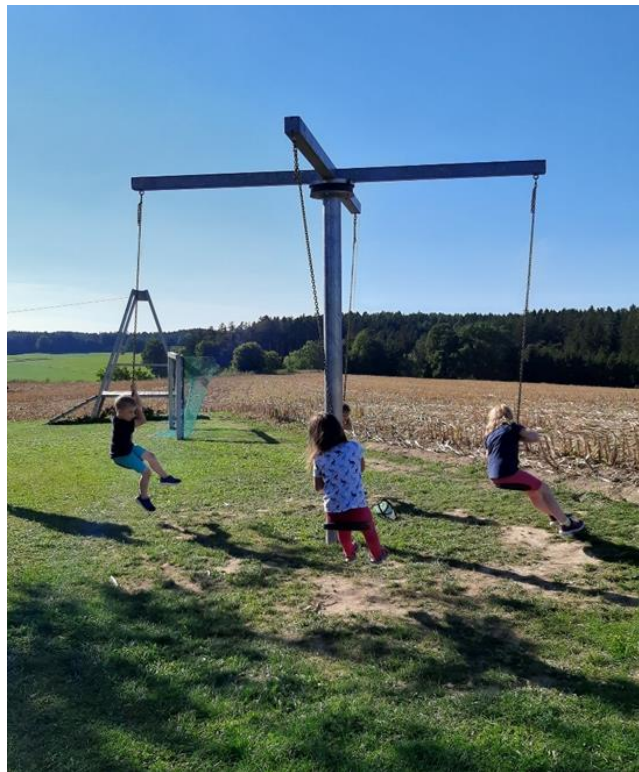
Ferienfahrten für Münchner Kinder: Kinderparadies Koanzhof Josef Schörghuber-Stiftung für Münchner Kinder (1)