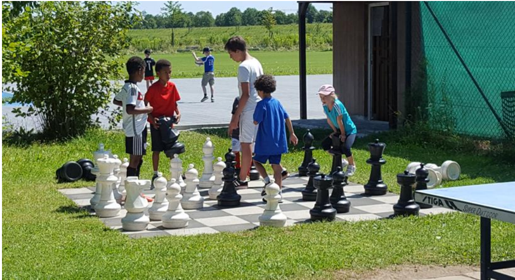
Sommercamp des TSV Maccabi München mit 30 ukrainischen Flüchtlingskindern Josef Schörghuber-Stiftung für Münchner Kinder (7)