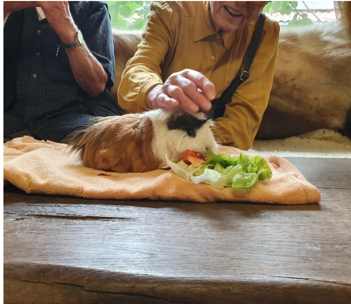
Besuch von Monis Tierfarm in einer Demenz-Wohngemeinschaft Stiftung für die individuelle Unterstützung hilfsbedürftiger Senioren (3)