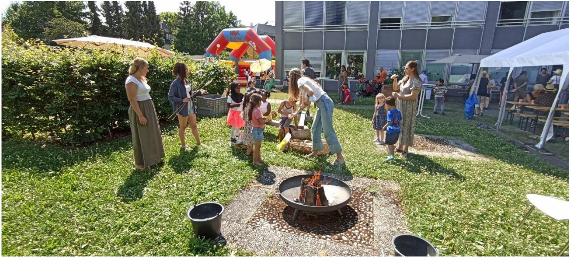
Sommerfest in einer Einrichtung für akut wohnungslose Familien Anna Krauß-Stiftung (5)