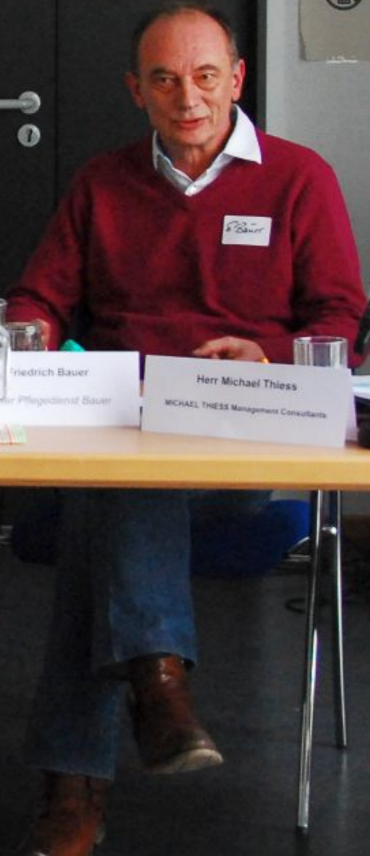
Friedrich Bauer Pflegedienst Bauer