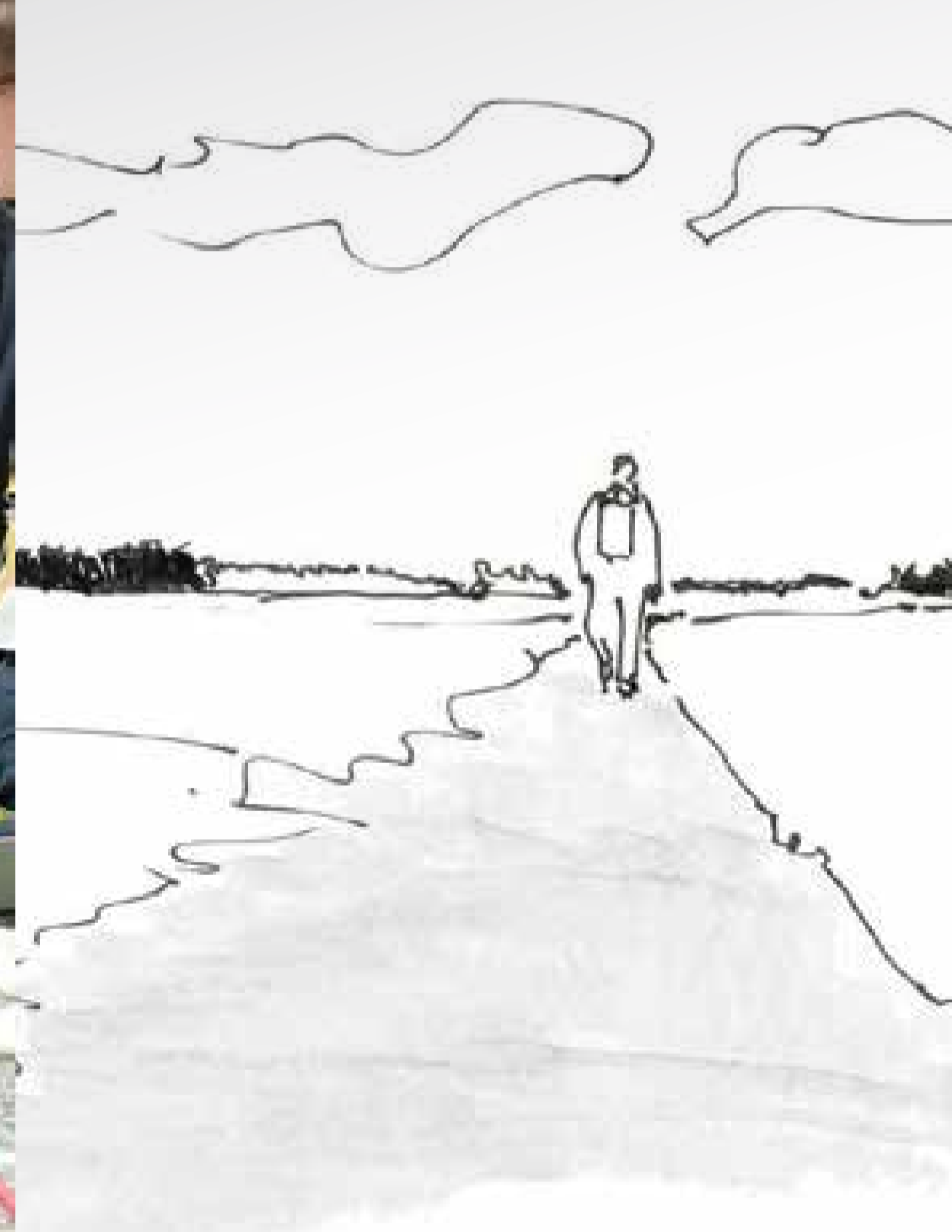
© LHM, Wege machen Landschaft, feiworff Landschaftsarchitekten et. al.