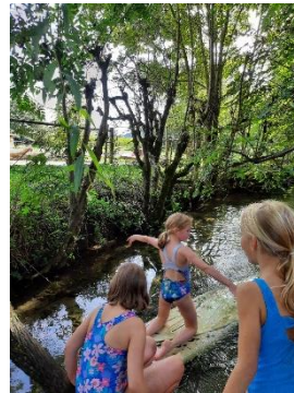
Ferienfreizeit Alte Mühle Bruck in Grafing - Josef Schörghuber-Stiftung für Münchner Kinder