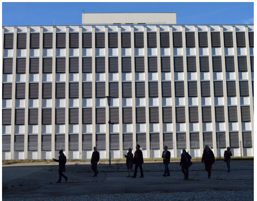
Rundgang über das Gelände