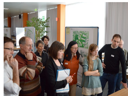
von links nach rechts: Expertinnen und Experten der Werkstatt, Plenum beim Werkstattgespräch, Diskus- sion am Tisch Städtebau

Die insgesamt zirka 100 Bürgerinnen und Bürger kamen zu etwa einem Drittel aus der direkten Nachbarschaft des Planungsgebietes, zu etwa zwei Dritteln aus dem BA 19 bzw. einige wenige aus dem übrigen München.