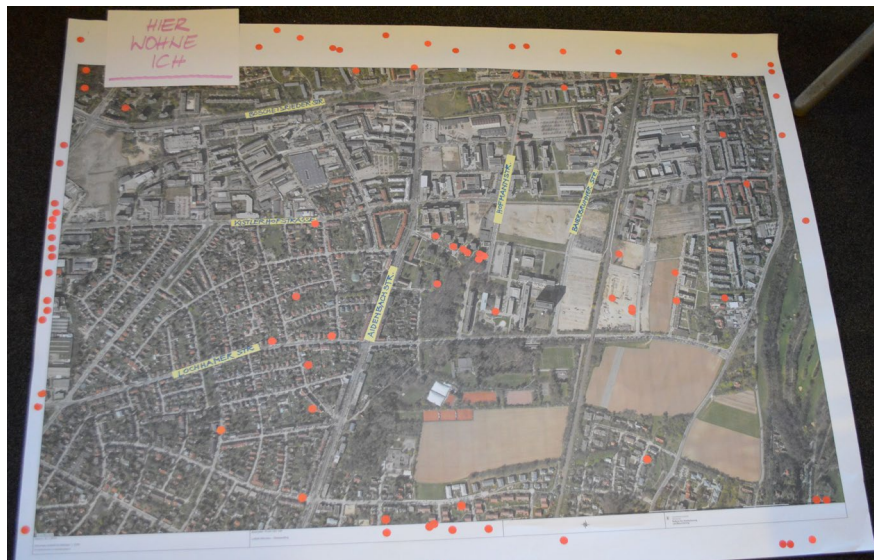
Wohnorte der Teilnehmenden