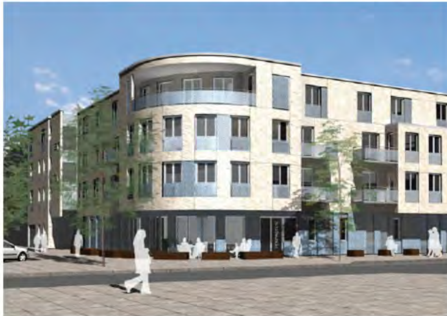
18: überarbeiteter Wettbewerbsbeitrag (Gutzeit + Ostermann)