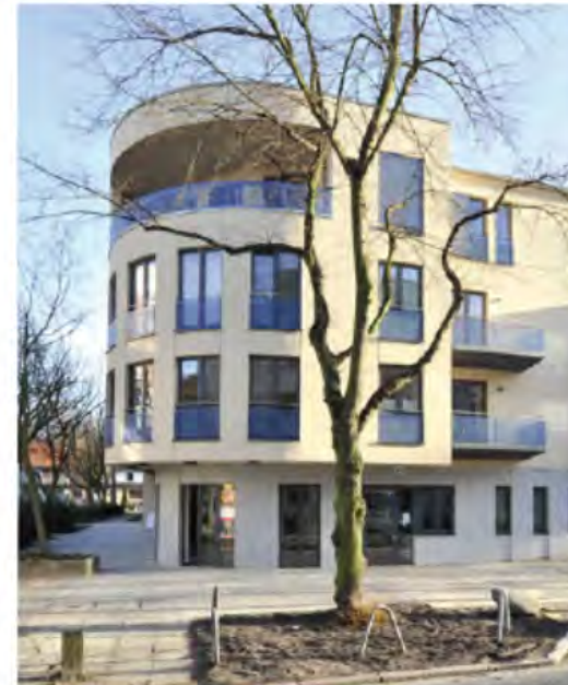
19: realisiertes Gebäude