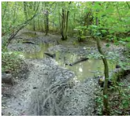
Dieser Trampelpfad war einmal 50 cm breit

Das Isartal ist ein einzigartiger Lebensraum für Natur und Mensch, deren Bedürfnisse und Interessen jedoch nicht immer deckungsgleich sind und zu Konflikten führen können. Besonders die zunehmende Freizeitnutzung des Isartals durch den Menschen erfordert einen respektvollen Umgang mit der Natur und untereinander. Dazu will diese Resolution beitragen.