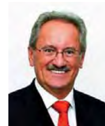
Christian Ude Oberbürgermeister der Landeshauptstadt München