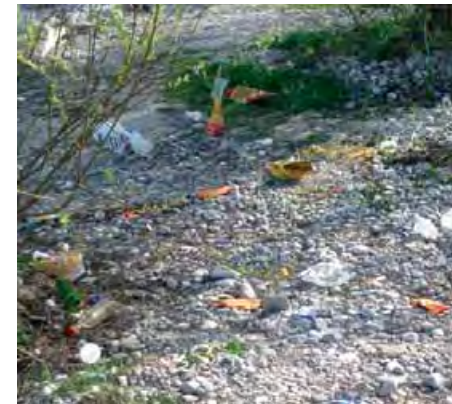
Am Flaucher – nach dem Wochenende

Die ökologisch hoch bedeutsamen Wälder in den Auen und an den Hängen des Isartals werden durch die Fahrspuren zerschnitten, ihre natürliche Vegetations-