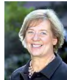
Johanna Rumschöttel Landrätin des Landkreises München