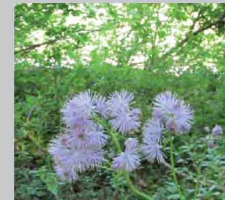
Akeleiblättrige Wiesenraute (links), Faltenrandige Schließmundschnecke (Mitte), Berg-Glanzschnecke (rechts oben), Bayerische Quellschnecke (rechts unten)